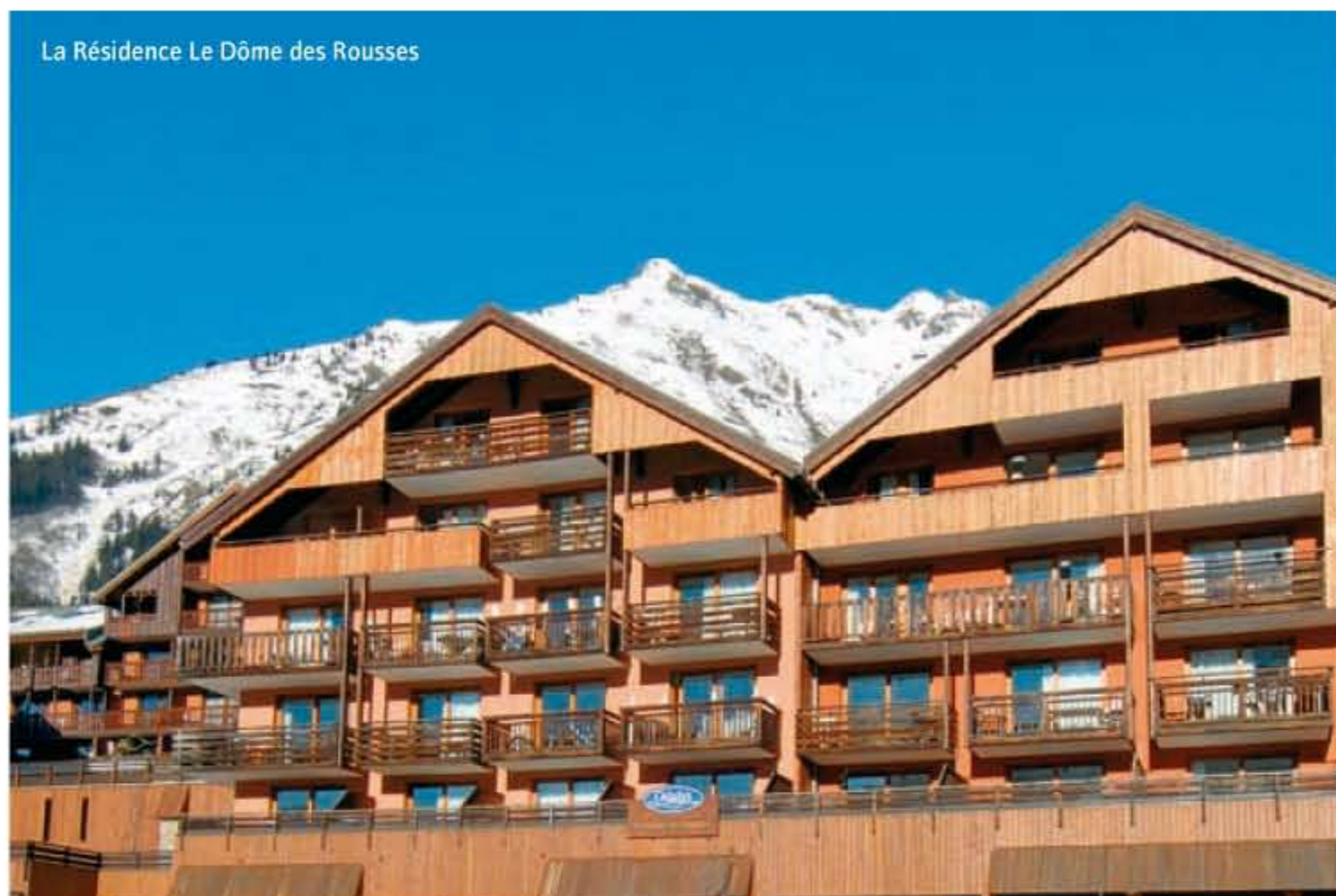
La Résidence Le Dôme des Rousses

Vaujany, village traditionnel accroché au soleil, face au superbe massif des Grandes Rousses, dispose de tous les équipements. Vacances sportives ou vacances détente, entre amis ou en famille... voilà une station unique où la tradition a su intégrer la modernité.