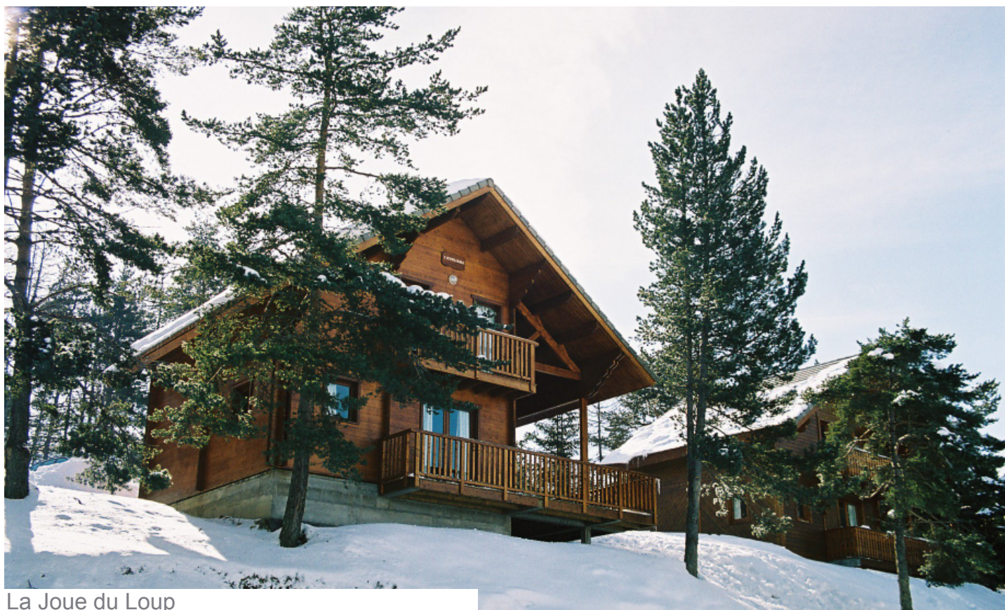
La Joue du Loup